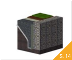
Hinterfüllung von Stützbauwerken